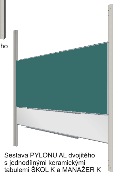
Sestava PYLONU AL dvojitého s jednodílnými keramickými tabulemi ŠKOL K a MANAŽER K