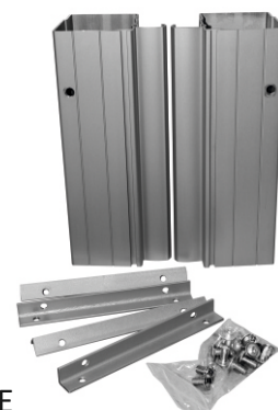
Prodloužení pro PYLON AL jednoduchý. Sada není součástí výrobku PYLON AL.